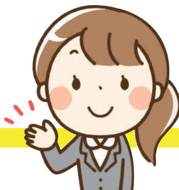
静岡 TTO、産学官連携 CD